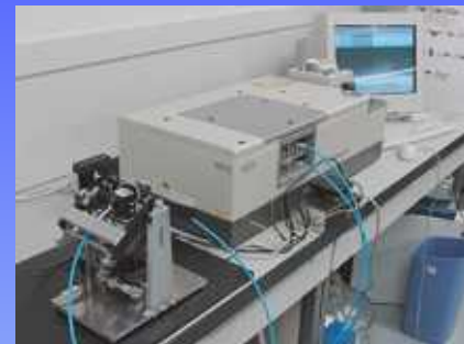
SPI-NIRS分光装置の模式図

近赤外領域で観測される倍音、結合音の強度は、赤外域に観測される基本音の吸収に比べて2桁から3桁も低く、決して高感度とは言えない。このため近赤外分光法は微量サンプルの測定には向かないと言わざるを得なかった。そこで我々は表面プラズモン共鳴 (SPR) を用いて倍音、結合音の吸収を増強させる方法として 表面増強プラズモン近赤外分光法 (SPR-NIRS) を開発している。